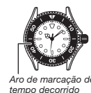
Aro de marcação de tempo decorrido